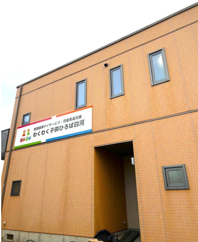
わくわく子供ひろば白河

今後は事業規模が大きくなる中で、「社員の教育、研修制度の充実化」により力をいれることで、更に福島県の福祉に力を尽くしてまいりますので、引き続きよろしくお願いいたします。